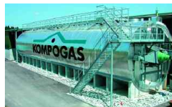
Oetwil am See, CH 10 000 t/a 2001