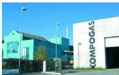
Bachenbülach, CH 8 500 + 4 000 t/a 2003