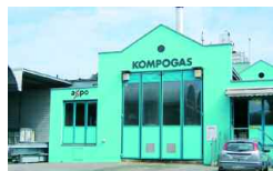
Rümlang, CH 3 500 + 5 000 t/a 1992