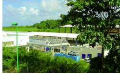
Martinique, Karibik 20 000 t/a 2005