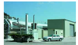
Volketswil, CH 5 000 t/a 2000