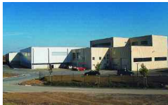
Alzey-Worms, D 24 000 t/a 1999