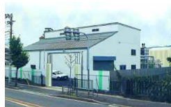
Kyoto, Japan 1 000 t/a 1999