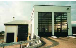
Frankfurt, D 15 000 t/a 1999