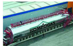
Roppen, A 10 000 t/a 2001