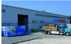
Ottenbach, CH 16 000 t/a 2006