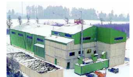
Hunsrück, D 10 000 t/a 1997