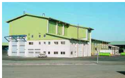
München-Erding, D 24 000 t/a 1997