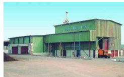
Braunschweig, D 24 000 t/a 1997