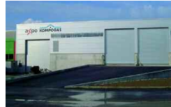
Aarberg, CH 12 000 t/a 2006