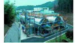
Kyoto, Japan 20 000 t/a 2004