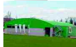
Pratteln, CH 15 500 t/a 2006