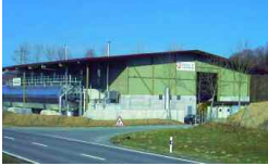
Lenzburg, CH 5 000 t/a 2005

» Weitere aktuelle Anlagen im Bau finden Sie auf unserer Homepage.