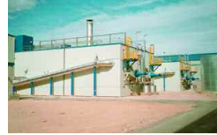
Rioja, Spanien 75 000 t/a 2005