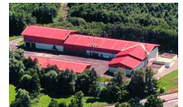
Kempten, D 10 000 t/a 1996