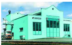
Bachenbülach, CH 10 000 t/a 1994