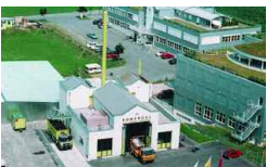
Samstagern, CH 10 000 t/a 1995