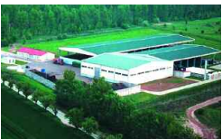
Weissenfels, D 12 500 t/a 2003