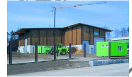
Jona/Rapperswil, CH 5 000 t/a 2000