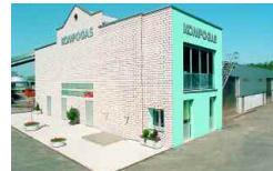
Niederuzwil, CH 5 000 + 8 000 t/a 1998