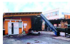
Rümlang, CH 500 t/a 1989