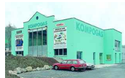
Otelfingen, CH 12 000 t/a 1996