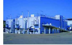
Passau, D 39 000 t/a 2004