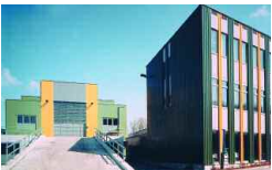
Lustenau, A 10 000 t/a 1997